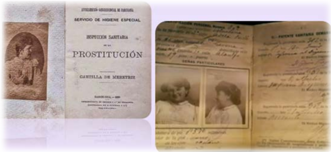
Figura 1: Ejemplos de Cartillas de inspección sanitaria de la prostitución de principios del siglo XX en España.

Fuente: Figura de la izquierda (González, 2019). Figura de la derecha (Guereña, 2018)